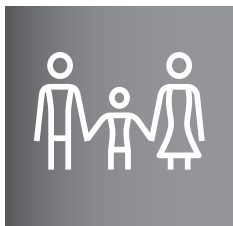
Tabela invalidnosti za določanje trajne izgube splošne delovne sposobnosti zaradi nezgode

Skladno s 25. členom splošnih pogojev za nezgodno zavarovanje je Tabela invalidnosti za določanje trajne izgube splošne delovne sposobnosti zaradi nezgode (v nadaljnjem tekstu: tabela) sestavni del splošnih pogojev in vsake posamezne pogodbe o nezgodnem zavarovanju.